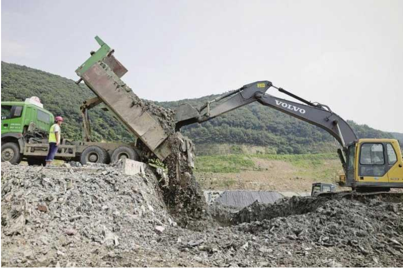
Slika 3. Deponija građevinskog otpada [8]