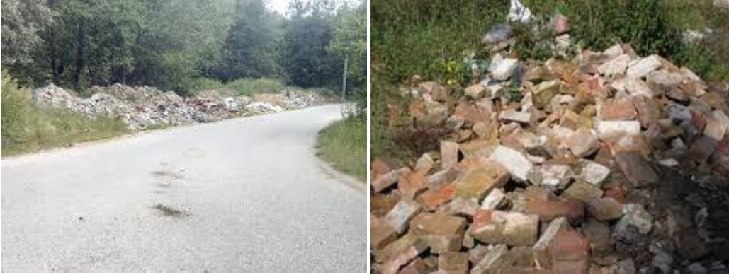
Slika 2. Divlje deponije građevinskog otpada

Na godišnjem nivou u Srbiji se, prema dostupnim podacima, stvara od 1 milion do 1,5 miliona m 3 građevinskog otpada. U našoj zemlji je reciklažna industrija prilično nerazvijena, a u prilog tome govori podatak da se svega 15 % ukupnog otpada (u koji spada i građevinski otpad) reciklira, što je izuzetno mali procenat u poređenju sa razvijenim zemljama. Prema podacima Asocijacije za zaštitu životne sredine, na teritoriji naše zemlje registrovano je 134 deponije na kojima se odlaže građevinski otpad. Naša zemlja je nedovoljno razvijena u pogledu reciklaže građevinskog otpada. Podaci ukazuju na činjenicu da se takav otpad ne posmatra kao potencijal za preradu i ponovnu upotrebu za određenu namenu. Prema navodima Srpske asocijacije za rušenje, dekontaminaciju i reciklažu, potrebno je da se implementiraju postojeće regulative evropskih zemalja koje daju uspešne rezultate iz ove oblasti [5, 6]. Međutim, njihova implementacija neće dati dobre rezultate sve dok se ne pristupi na isti način, i sprovođenju zakona, i sprovođenju kaznenih mera zbog njegovog nepoštovanja. U oblasti građevinske industrije otpad se može podeliti u nekoliko grupa i to [7]: