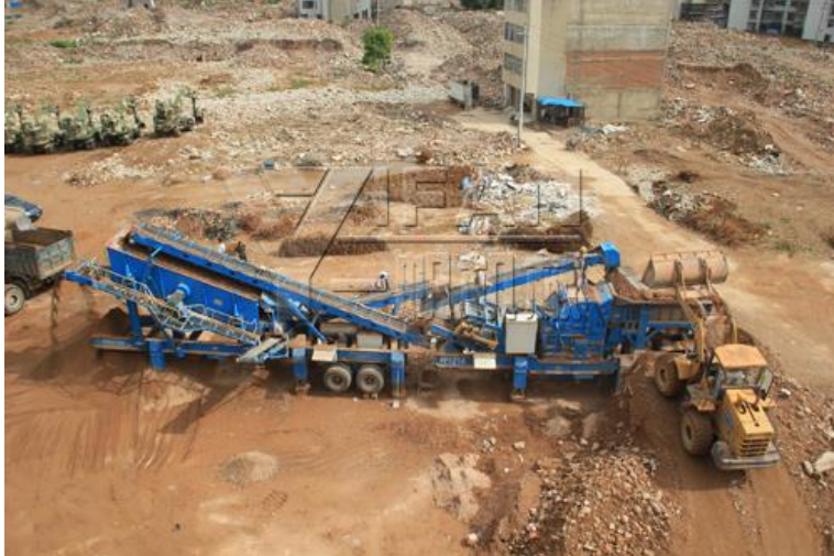
Slika 5. Mobilna drobilica za beton [13]

Razlika u odnosu na statično postrojenje za reciklažu otpada je u tome što je osnovna oprema mobilnog postrojenja instalirana na šasiji tipa guseničara ili točka. Pored sistema za napajanje, drobljenje, prosejavanje i transportnog sistema, postrojenje je opremljeno sistemom za kontrolu prašine kako bi se smanjilo zagađenje vazduha tokom celog procesa. U odnosu na namenu i svrhu drobljenja (ruda ili otpad) strukture ove opreme su različite, ali sve one imaju zajedničke prednosti kao što su: