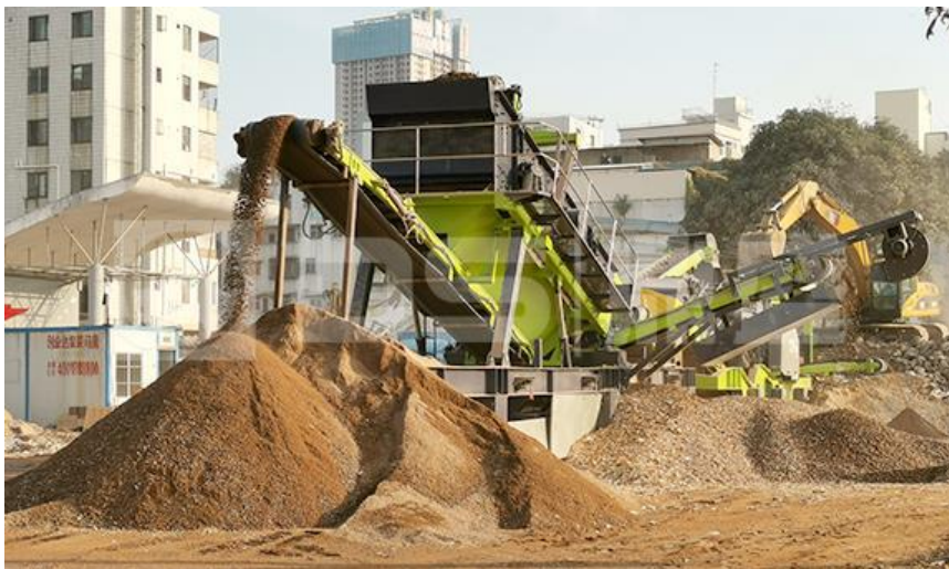
Slika 6. Mobilno postrojenje za reciklažu